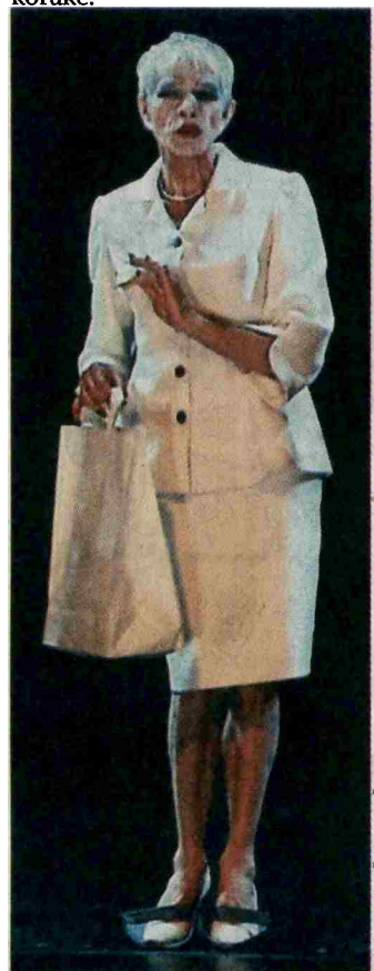
Barišičeva najslavnejša vloga ostaja gospa Smith v Taufferjevi postavitvi absurde Plešaste pevke.

Vesel prstana sporoča še: “Dragi vsi moji soigralci, zahvaljujem se vam, da sem skupaj z vami predeskal to pot. Zahvala režiserjem, dramaturginjam, teatru, tehniki, garderobi, maski in velika zahvala publikli, ki je spremljala moje odrske korake.” •