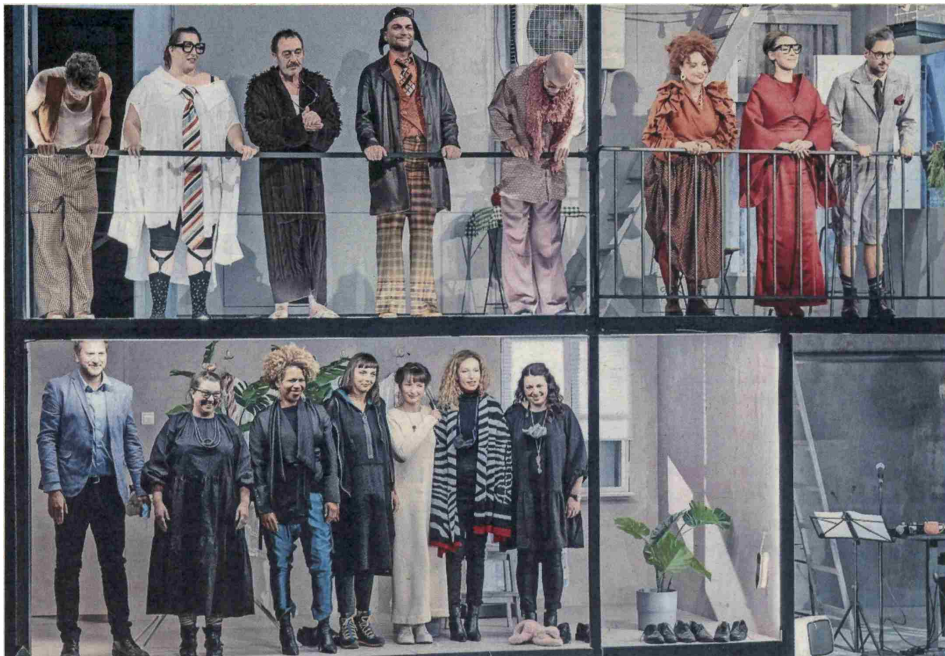
Ustvarjalna ekipa predstave Čriček in temačni občutek je začela sezono, posvečeno mentalnemu zdravju.

“(Smeh) Strokovnjak je malce preveč. Spomnili ste me na anekdoto iz konca srednje šole. Hotel sem se vpisati na Akademijo za gledališče, radio, film in televizijo, vendar nisem hotel biti samo