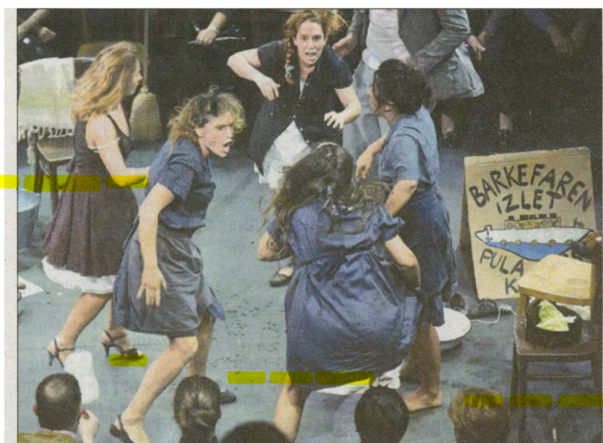
Prizor iz nagrajenih Baruf