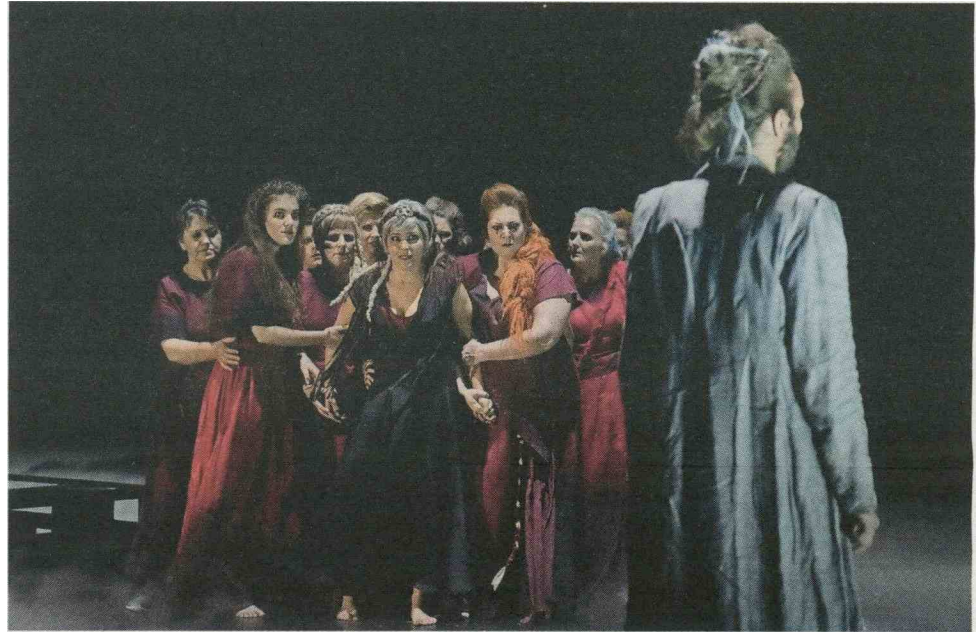
V SNG Nova Gorica so kot zadnjo na velikem odru v tej sezoni uprizorili tragedijo Trojanke.

večerje, a prazna, zapuščena, spremenjena v nagnjeno pisto, po kateri koraka Juda. Njegove zgoščene filozofske traktate o etiki, veri in dvomu v uprizoritvi rahlja vrsta detajlov in učinkov, tudi potujitvenih. Na koncu je vse "le" teater. •